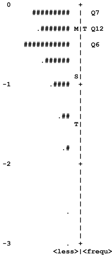
Wright Map Taburan Responden-Item