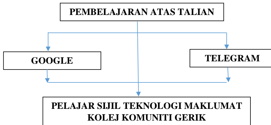
Rajah 1: Kerangka Konsep Kajian

Kerangka konsep pada Rajah 1 menerangkan bahawa pengkaji menggunakan pelajar Sijil Teknologi Maklumat sebagai sampel kajian bagi mengetahui persepsi mereka terhadap pembelajaran matematik secara atas talian. Terdapat dua medium yang digunakan iaitu Google Classroom dan Telegram. Dalam kajian ini, pengkaji menggabungkan dua jenis teori bagi pembelajaran secara atas talian iaitu teori konstruktivisme dan teori kognitif. Teori ini saling diperlukan dan digunakan sebagai panduan pembelajaran secara atas talian. Teori konstruktivistik menyatakan pembelajaran yang diperolehi oleh pelajar akan dimanfaatkan oleh pelajar dalam kehidupan seharian. Teori pembelajaran ini juga melihat keupayaan pelajar untuk mengaplikasi dan mengadaptasi kaedah baru pembelajaran agar seiring dengan peredaran masa (Subadrah dan Malar, 2005).