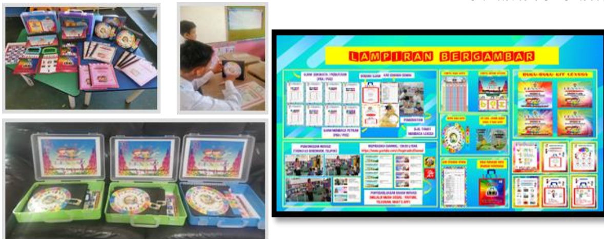
Rajah 2: Kit LEXSSA Mengandungi Tujuh (7) Item.