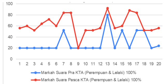
Rajah 1: Perbandingan Markah Suara (100%) Pra dan Pasca-KTA

Analisis antara komponen tajwid pra dan pasca-KTA pula menunjukkan nilai R (korelasi) menurut Rank Pearson r = \frac{\sum((X - M_x)(Y - M_y))}{\sqrt{(\sum SS_x)(\sum SS_y)}} ialah 0.6232. Nilai korelasi ini menunjukkan hubungan positif antara kedua-dua pemboleh ubah adalah sederhana. Ini bermakna ada kecenderungan pemboleh ubah X menghasilkan markah yang tinggi bersama pemboleh ubah Y atau sebaliknya. Secara teknikal, nilai ini menunjukkan korelasi yang signifikan di mana Nilai R 2 ( the coefficient of determination ) ialah 0.3884; Nilai P dalam Rank Pearson ialah .00333; dan ini menunjukkan bahawa Nilai P merupakan nilai yang signifikan pada p < .05 . Dari sudut pemerolehan peratusan purata ( average mean ) pula, dari 50.8% ke 69.6% terdapat perbezaan positif sebanyak 18.0% seperti yang terdapat pada Jadual 2. Perbezaan markah tajwid pra dan pasca-KTA ketara pada infogram di Rajah 2.