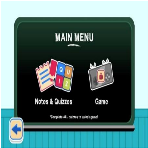
Rajah 1 (b): Antaramuka Aplikasi Jawlah Tiktoq Versi Murid

Dalam aplikasi Jawlah Tiktoq ini, murid boleh memilih karakter dan perlu menghabiskan aras (level) 1) sebelum meneruskan permainan ke level 2 dan level 3. Murid yang gagal pada level 1 perlu mengulang level tersebut sehingga berjaya.