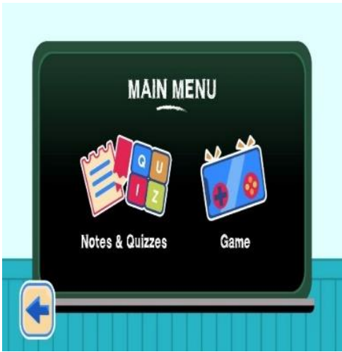
Rajah 1 (a): Antaramuka Aplikasi Jawlah Tiktoq Versi Guru