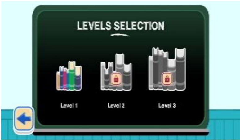
Rajah 2: Antaramuka Pemilihan 'Level'

Dalam aplikasi Jawlah Tiktoq ini, murid boleh memilih karakter dan perlu menghabiskan aras (level) 1) sebelum meneruskan permainan ke level 2 dan level 3. Murid yang gagal pada level 1 perlu mengulang level tersebut sehingga berjaya.