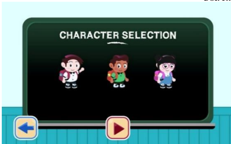
Rajah 3: Antaramuka Pemilihan Karakter

Selain itu, aplikasi Jawlah Tiktoq ini juga menggabungkan elemen audio dan gamifikasi yang bertujuan untuk menarik perhatian murid di samping membina suasana didik hibur dalam aktiviti PdPc (pembelajaran dan pemudahcaraan) bahasa Arab. Menurut Saipolbarin Ramli et al., (2019) konsep gamifikasi dalam aktiviti PdPc secara tidak langsung dapat membantu merangsangkan minat pelajar terhadap sesuatu topik. Menurutnya lagi, terdapat banyak kajian berkaitan gamifikasi bahasa secara maya dalam proses meningkatkan tahap penguasaan pelajar dalam menguasai bahasa kedua.